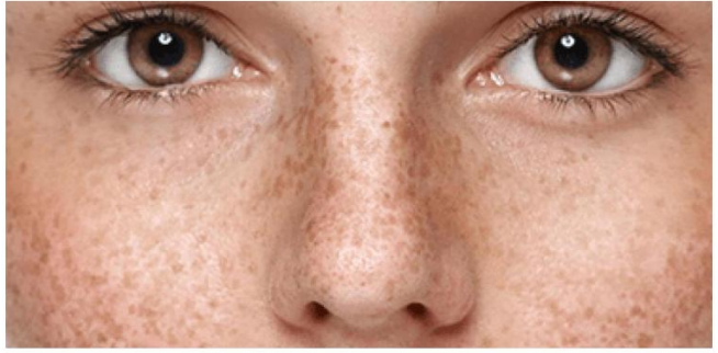
taches de rousseur